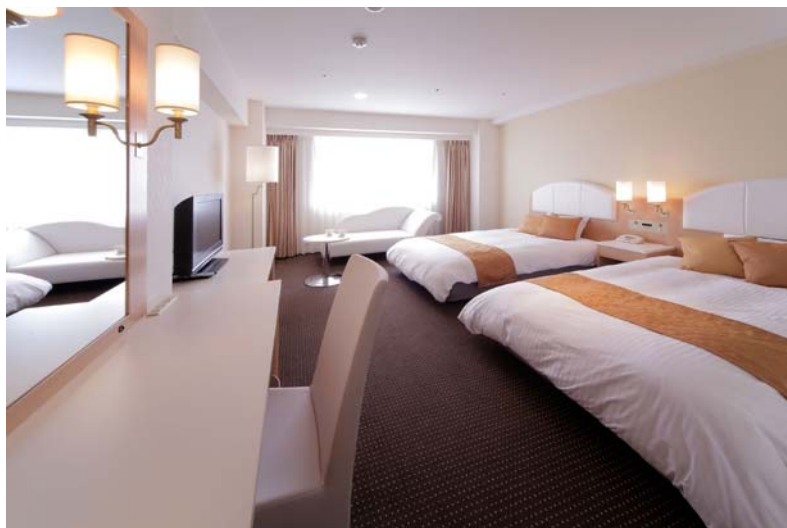
フェアリーツイン (Fairy Twin)