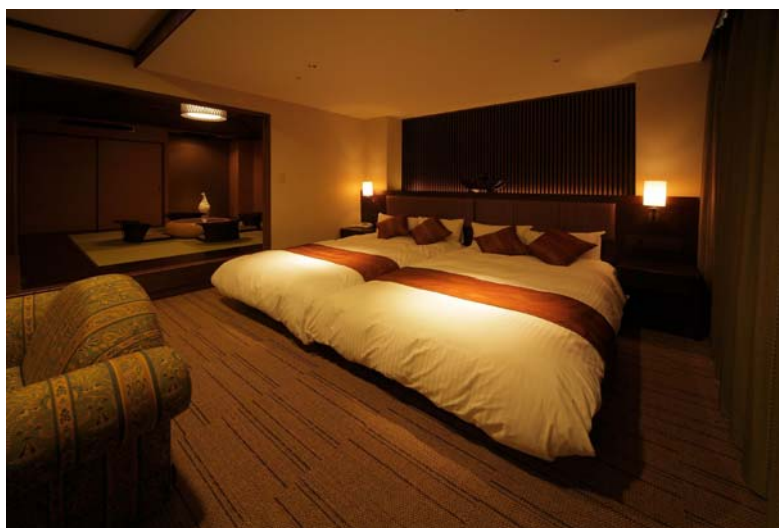
オリエンタルルーム (Oriental Room)