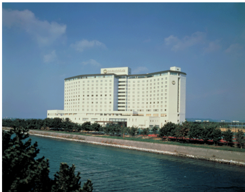
浜名湖ロイヤルホテル 全景