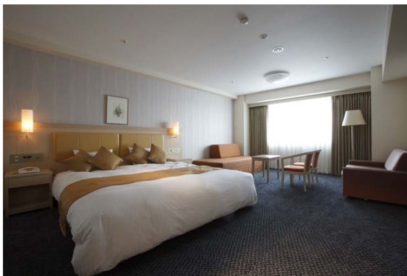
プレミアムダブル (Premium W)