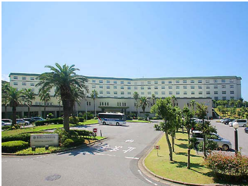
南房総富浦ロイヤルホテル 外観