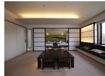
「フォレストスイート」