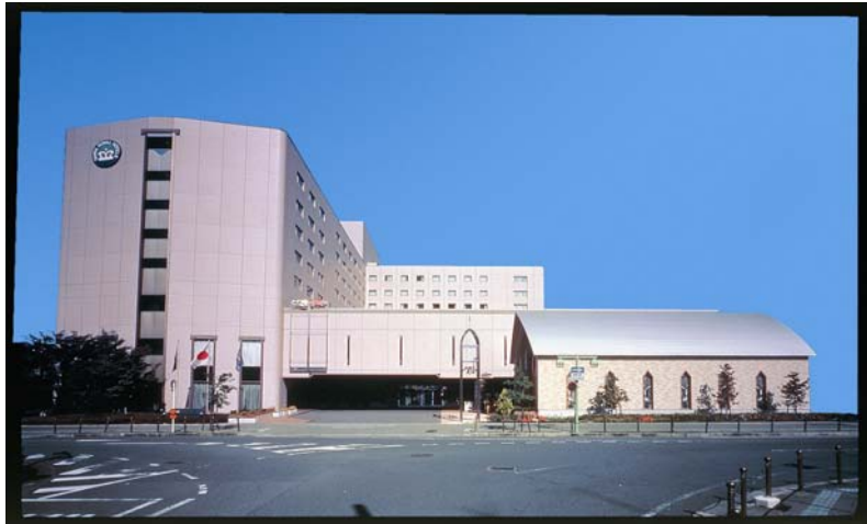
榑原ロイヤルホテル 全景