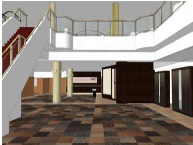
「フロントエントランス」(イメージ)

「フロントエントランス」は、「モダニズム飛鳥」をデザインコンセプトに掲げ、古都奈良に相応しい品格のあるロビーと吉野桜を象徴するフロントにし、「ロイヤルホール」は、「飛鳥京」「藤原京」「万葉集」などの日本の伝統を表現した披露宴会場にしました。あわせて、1階フロント・ロビーフロアもリニューアルします。