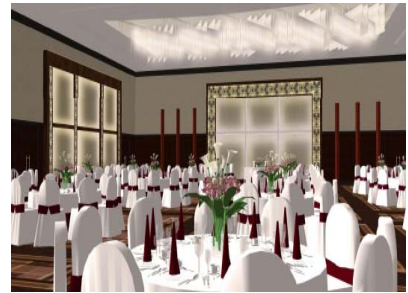
「ロイヤルホール」(イメージ)