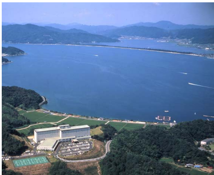
天橋立 宮津ロイヤルホテル 全景