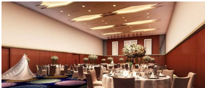
【 GRAND HALL 】(イメージ)

大切なゲストの方と過ごす特別な時間、おもてなしの心を大切にゲストの方をお迎えいたします。