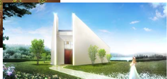
【 独立型チャペル「Lovista 愛の展望」 】(イメージ) 内観（トワイライト WEDDING） ・ 外観