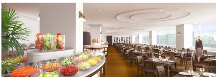
【 レストラン四季 】(イメージ)

眼下に広がる景色を楽しみながらお食事頂けるカウンターを設け、ナチュラル感を演出し、優しい透明感の中くつろげる空間へと変貌を遂げました。