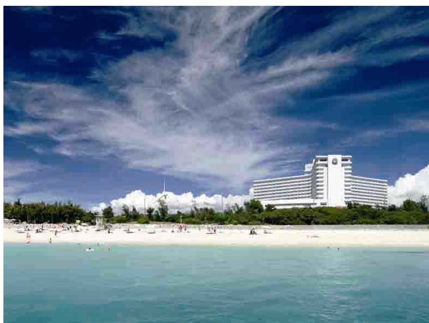
沖縄残波岬ロイヤルホテル 遠景

お問い合わせ先 大和リゾート株式会社 広報室 電話：06-6229-7218 FAX：06-6229-7202