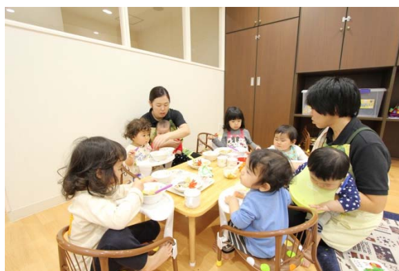
ロイヤルキッズガーデンの様子