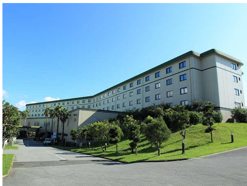
南房総富浦ロイヤルホテル 全景