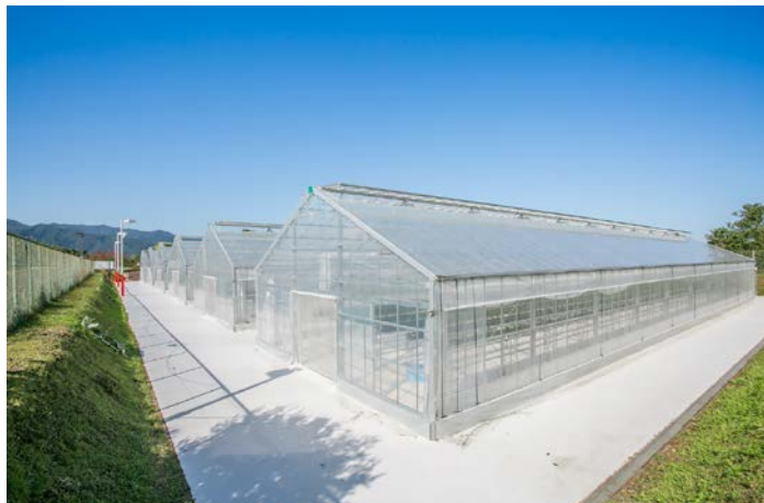
いちごハウス外観