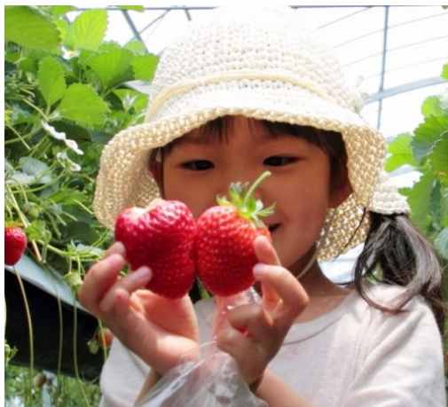
いちご狩り (イメージ)