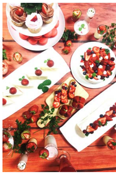
ストロベリービュッフェ (イメージ)