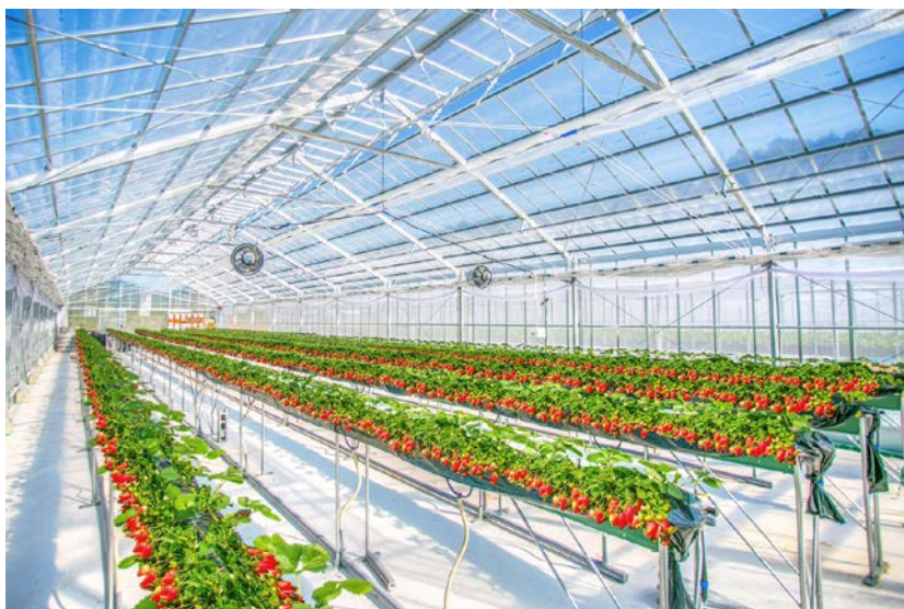
いちごハウス内部 (イメージ)