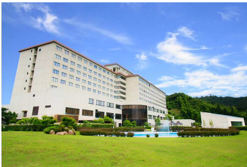
天橋立 宮津ロイヤルホテル 全景