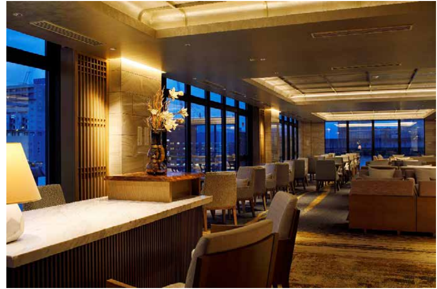
9階<エグゼクティブラウンジ>