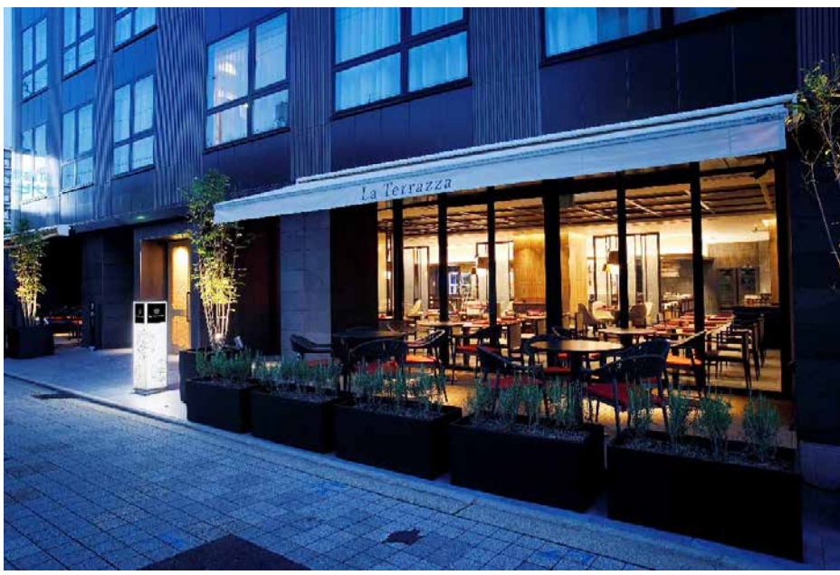
<オールディダイニング「ラ・テラツァ」>