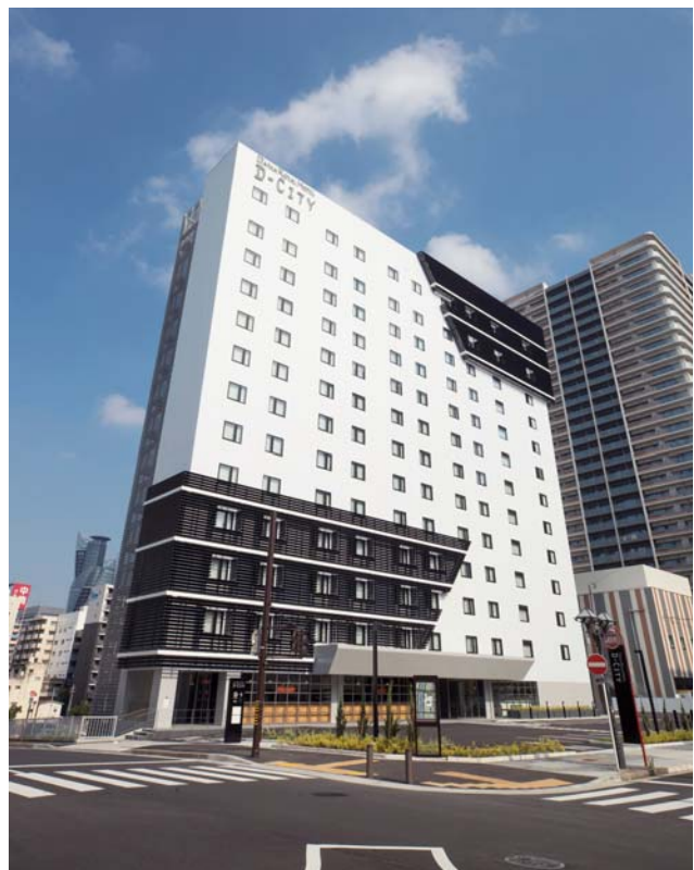
【「ダイワロイヤルホテル D-CITY 名古屋納屋橋」外観】