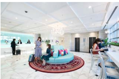
【ロビー・フロント】

さらに、アメニティーの無料サービスや、インバウンドに対応した海外通信サポート、美容や健康を意識した各種アイテムを取り入れ、快適な宿泊をサポートします。