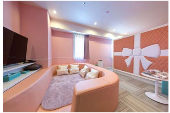
【客室：レディースフォースルーム】

また、複数の女性でのご宿泊の際にも客室で愉しんでいただけるよう、ローソファでゆったりと寛げる「レディースフォースルーム（最大 4 名利用）」をご用意しました。女性同士の「お泊まり会」など、普段の利用とは違ったご宿泊も可能です。