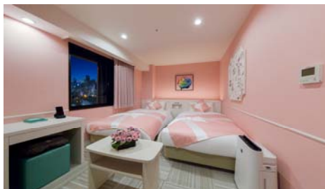
【レディーススタンダードツイン】