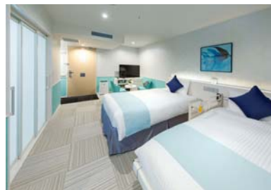
【ユニバーサルツイン】