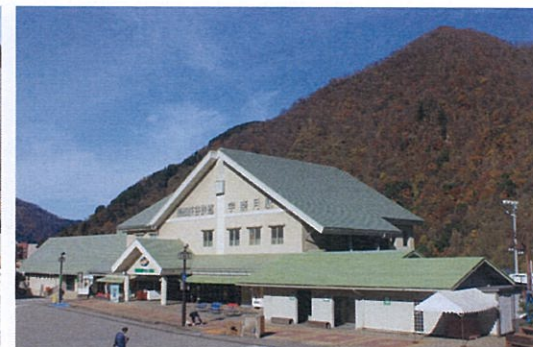
▲黒部峡谷鉄道 宇奈月駅 宇奈月温泉駅から:徒歩5分