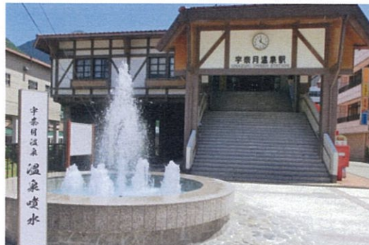
▲富山地方鉄道鉄道 宇奈月温泉駅