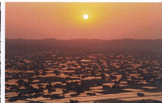
▲散居村展望台より