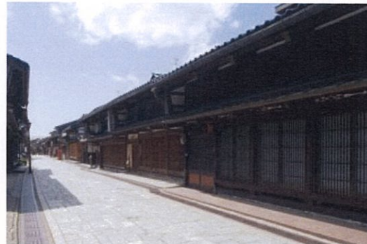
▲金屋町 千本格子の家並み